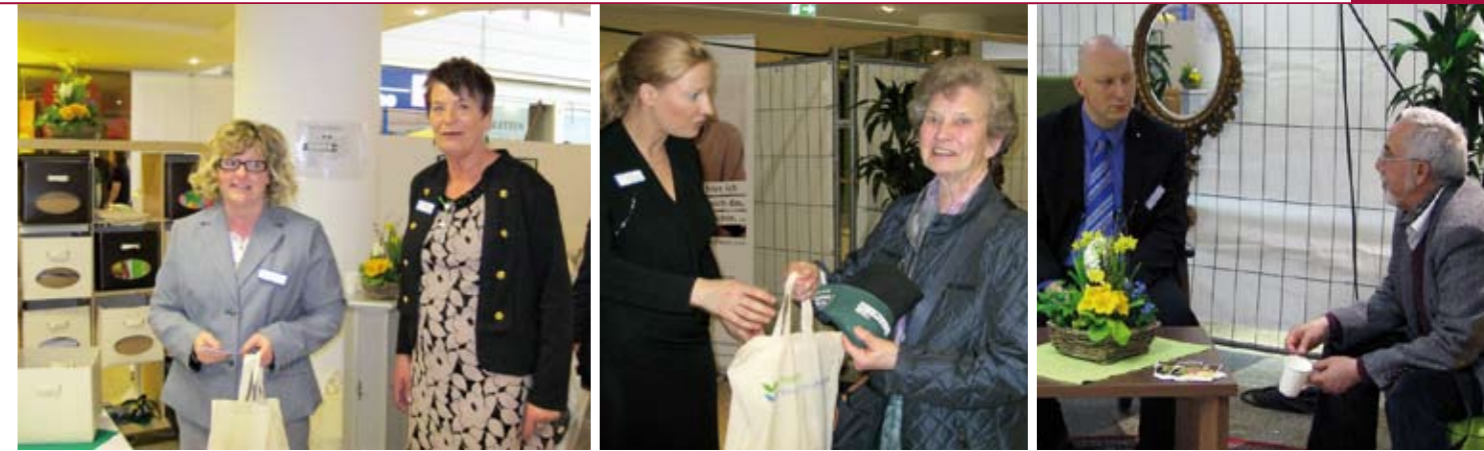
Beim Informationsaustausch: Besucher und Mitarbeiter der Sozialholding auf der Seniorenmesse